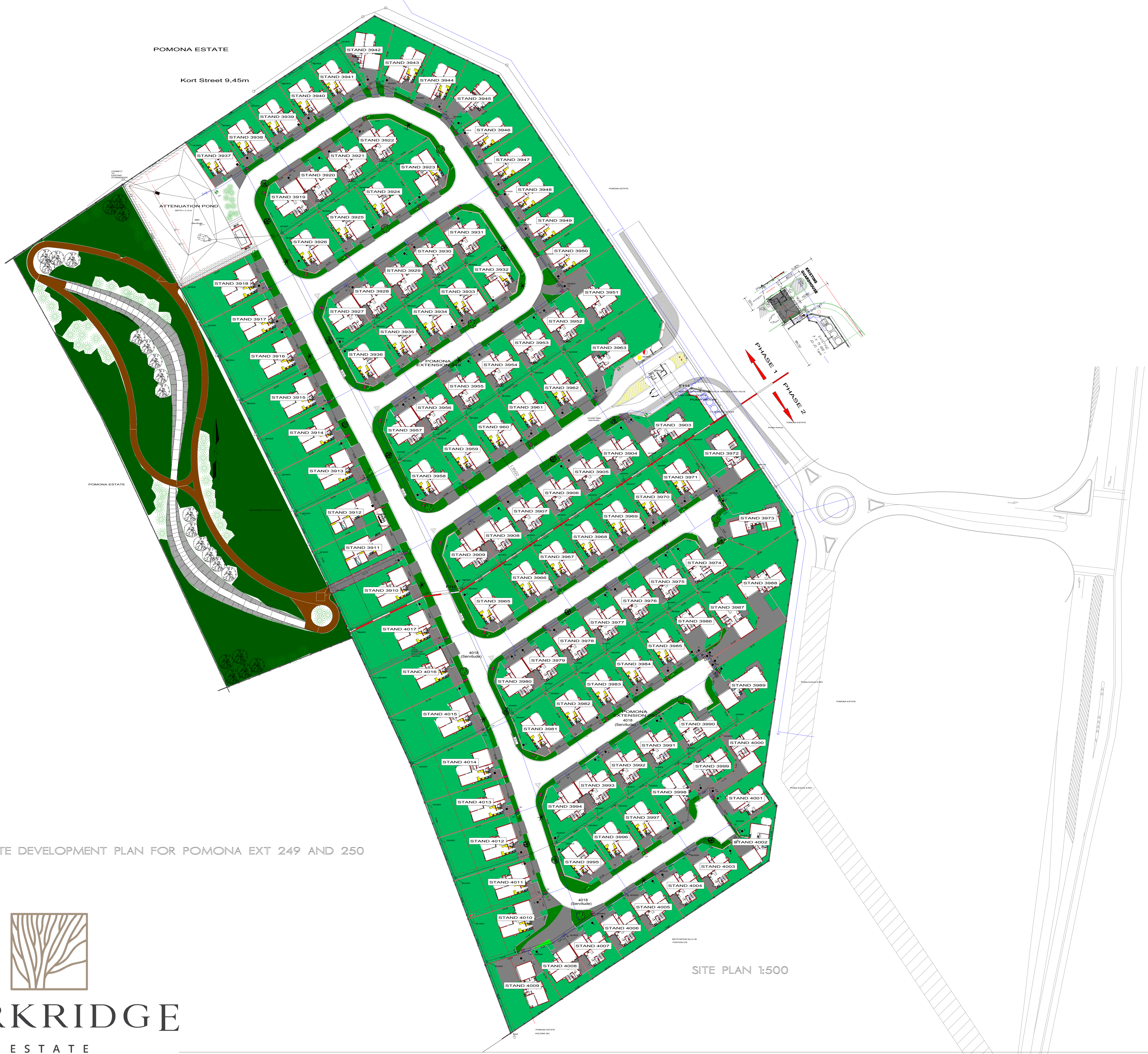
POMONA EXTENSION 249 POMONA EXTENSION 250